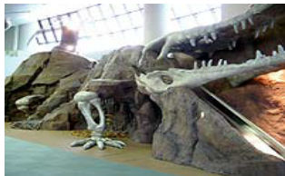
▲惑星ハートピアが再現されたアストロキャン