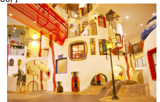
▲キッズプラザ大阪のシンボル「こどもの街」

「ワールドボックス」では、世界の5つの国の文化にふれることができる。セネガル、中国、アメリカなど…。