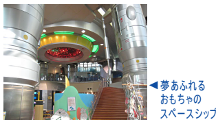
▲夢あふれるおもちゃのスペースシップ