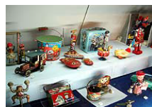
▲懐かしいおもちゃがたくさん

土曜・日曜は、いろんなイベントが目白押し！HPでイベント情報をチェック☆割引チケットもあるよ。