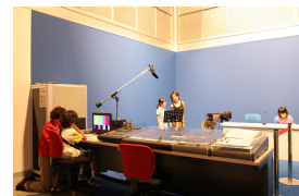
▲本物そっくり！ニュースキャスターカメラマンになれる「わいわいスタジオ」