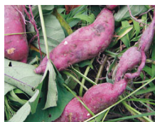
▲いろんな形をしたさつまいもがとれるよ！