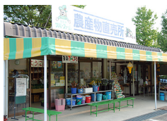
▲新鮮なとれたて野菜がいっぱい！！