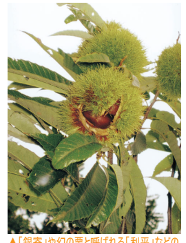
▲「銀寄」や幻の果と呼ばれる「利平」などの葉拾いが楽しめる