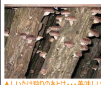
▲しいたけ狩りのあとは...美味しいしいたけバーベキューが待っている