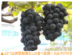
▲ぶどうは時間制限なしの食べ放題！おみやげ付き