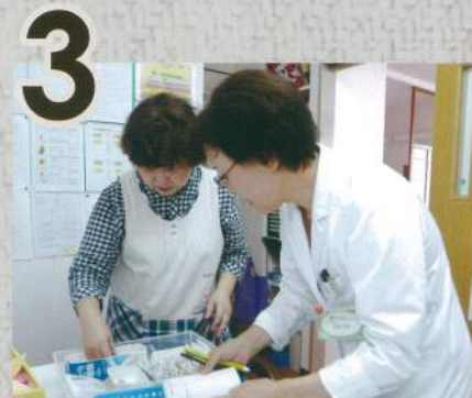
介護者さんから利用者さんの近況、薬の効き具合などを確認。