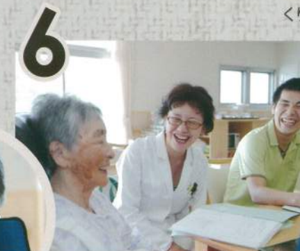
こういう積み重ねが患者さんとの関係性を強くする。