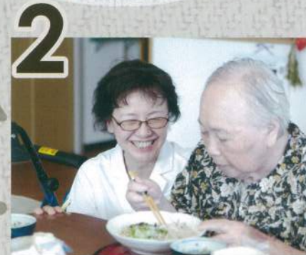
まずはみなさんの表情をチェック!