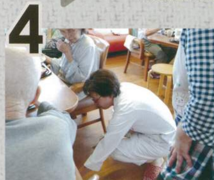
実際に自分の目でも見てチェック。