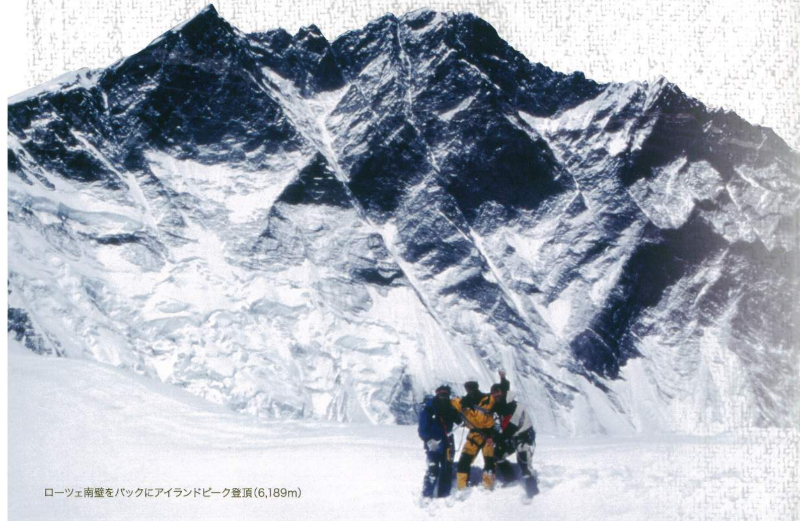
ローツェ南壁をバックにアイランドピーク登頂(6,189m)