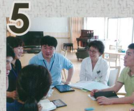
今後のケアの方向性を考えるため、医療関係者、介護関係者が一同に介してじっくり話し合い。