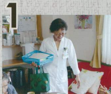
いつもの訪問セットを持って施設に到着。