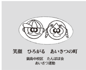
笑顔 ひろがる あいさつの町 鍋島中校区 たんぽぽ会 あいさつ運動